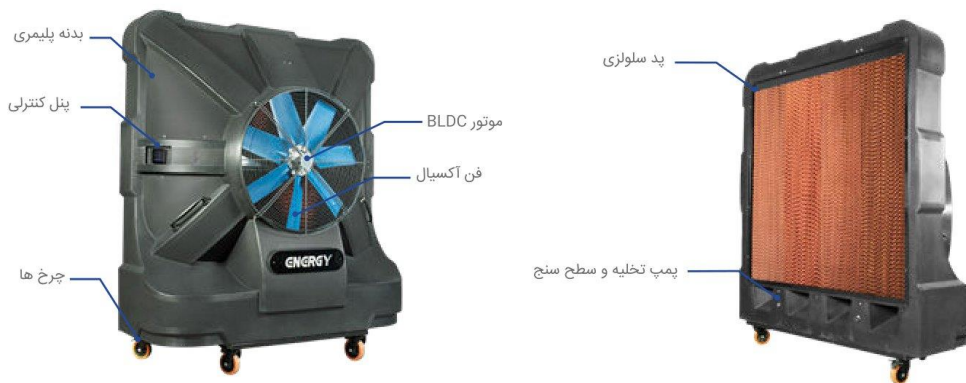
تامین سرمایش موضعی

تامین شرایط آسایش حرارتی در اماکن بزرگ با کاربری های مختلف در فصل گرما همیشه یک دغدغه است. خصوصا در فضاهای صنعتی که گاهی نیاز به جابجایی خطوط تولید و محل استقرار نفرات می باشد. سیستم سرمایش موضعی با قابلیت جابجایی آسان، هزینه خرید اولیه پایین تر، عدم نیاز به کانال کشی و ساخت پایه در ارتفاع یک گزینه مناسب است. کولر صنعتی مدل AC 2000 B با فن آکسیال و موتور BLDC (Brushless DC) و با ظرفیت هوادهی ۲۰۰۰۰ متر مکعب در ساعت، همراه با مصرف برق پایین، سرمایش موضعی اماکن صنعتی و بزرگ را فراهم می سازد. راندمان تبخیر این دستگاه به واسطه پد سلولزی با ضخامت ۱۵ سانتی متر ۸۵ درصد بوده که هوای خنک تری را نسبت به سیستم های مشابه تامین می کند.